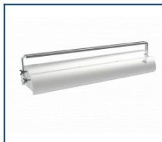
Кронштейн лира Angar 180 (комплект)