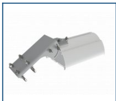
Кронштейн консоль поворотная Piton/Angar (комплект)