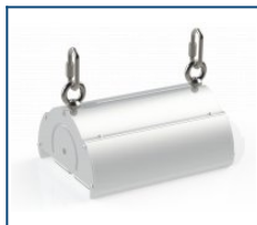
Кронштейн рым-гайки Angar (комплект)